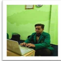
Gambar 4. Menyampaikan Materi

2026). Melalui pembuatan materi kultum yang telah dipersiapkan tersebut, kegiatan yang dilaksanakan lebih terarah dan terstruktur, sehingga mahasiswa tidak kesulitan untuk menyampaikan apa yang harus disampaikan.