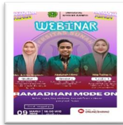
Gambar 1. Membuat Flyer Webinar

Bagian dari upaya mendukung pelaksanaan kegiatan, mahasiswa membuat media informasi berupa flyer yang digunakan untuk memperkenalkan serta menginformasikan program kulture Ramadhan kepada remaja di Desa Kedungrejo. Pembuatan flyer ini bertujuan untuk membantu menyebarkan informasi kegiatan yang lebih efektif sekaligus mendorong partisipasi remaja agar lebih aktif mengikuti kegiatan tersebut (Rojana et al. , 2025). Dengan adanya pembuatan media tersebut, para remaja dapat mengetahui jadwal dan tujuan kegiatan yang akan dilaksanakan.