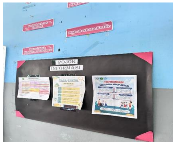
Gambar 6. Refleksi/Evaluasi

Evaluasi kegiatan dilakukan dengan menempatkan poster edukatif pada area strategis di lingkungan sekolah, seperti dinding kelas dan lorong sekolah, agar pesan-pesan tentang pentingnya hidup bersih dan sehat dapat terus terlihat oleh siswa. Melalui cara ini, diharapkan nilai-nilai yang telah disampaikan selama kegiatan pembelajaran dapat terus diterapkan secara berkelanjutan dalam kehidupan sehari-hari.