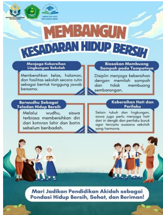
Gambar 5. Demostrasi

Tahap demonstrasi dilakukan dengan memanfaatkan gambar poster edukatif sebagai alat bantu visual dalam menjelaskan penerapan perilaku hidup bersih dan sehat. Selama proses demonstrasi, mahasiswa menjelaskan setiap gambar secara rinci sambil memberikan contoh langsung di hadapan siswa, sehingga pembelajaran menjadi lebih kontekstual dan interaktif.