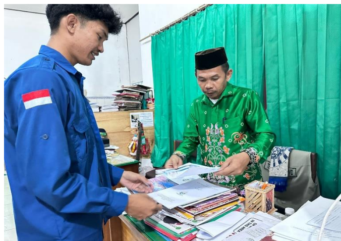
Gambar 2. Wawancara dengan Guru tentang penggunaan Poster

Poster merupakan hasil karya seni atau desain grafis yang berisi perpaduan antara gambar dan tulisan pada lembaran kertas berukuran besar. Umumnya, poster dipasang pada dinding atau permukaan datar lainnya dengan tujuan menarik perhatian orang yang melihatnya semaksimal mungkin (Setianto, 2016). Hal tersebut sesuai dengan pandangan Megawati, (2017) Poster bisa berupa gambar dengan perpaduan warna yang menarik sehingga mampu menarik perhatian orang yang melihatnya, melalui poster, pembuatnya berusaha menyampaikan pesan atau makna tertentu yang sesuai dengan tujuan yang ingin dicapai. Dengan penggunaan media poster yang menarik dapat memudahkan memori siswa untuk mengingatnya dalam jangka waktu yang cukup lama (Nurfadhillah et al., 2021). Pada gambar 2. Wawancara guru dibawah ini.