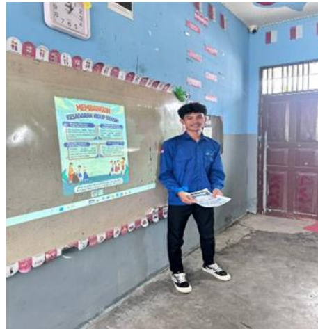
Gambar 3. Penyampaian Materi