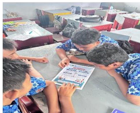
Gambar 4. Diskusi / Tanya Jawab