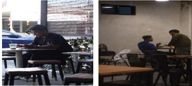
Gambar 1. Suasana Kafe

sehingga berpotensi menjadi media alternatif dalam penyampaian pesan dakwah secara nonformal.